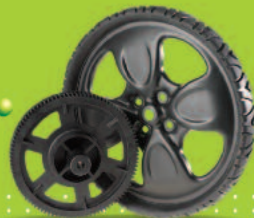
Surmoulage par injection plastique

ETUDE CAO MAQUETTES ET PROTOTYPES OUTILLAGES SERIES ET PROTOTYPES INDUSTRIALISATION