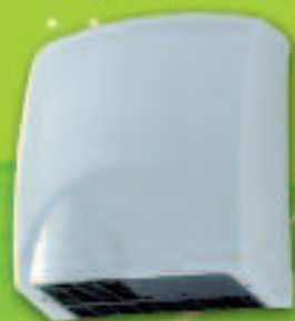
Moulage par injection plastique